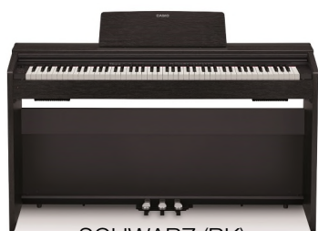
SCHWARZ (BK) EAN: 4971850362364