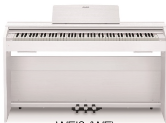
WEIß (WE) EAN: 4971850362371