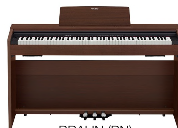
BRAUN (BN) EAN: 4971850362425