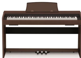
BRAUN (BE) EAN: 4971850362319