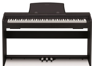
SCHWARZ (BK) EAN: 4971850362302