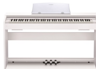
WEIß (WE) EAN: 4971850362326